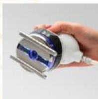
MIO FASCIAL MATRIX

Un manipolo corpo brevettato per agire sulla fascia profonda del muscolo, liberando i piani dei tessuti rendendo di nuovo fluido il movimento corporeo. Agisce sugli accumuli adiposi ostici da ridurre, aderenze, cellulite in fase di sclerotizzazione.